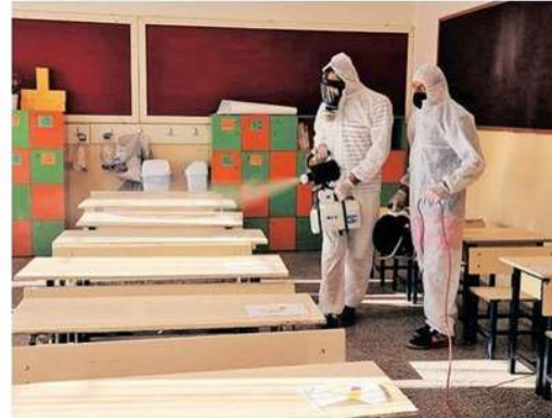
Okullar ders öncesi dezenfekte edildi.

2021-2022 Eğitim ve Öğretim Yılı'nda okul öncesi ve birinci sınıflar için dün ders zili çaldı. Türkiye genelinde minik öğrenciler uyum haftası kapsamında okula başladı. Saat 10.00 ile 12.00 arasında 3 gün sürecek yüz yüze uyum eğitimi öncesi okullar, yeni tip koronavirüs önlemleri kapsamında dezenfekte edildi, sınıflarda düzenlemeler yapıldı. Minikler sabah aileleri ile birlikte okulun yolunu tuttu. Veliler de çocukları kadar heyecanlıydı. Pandemi kuralları çerçevesinde başlayan uyum eğitiminde okul bahçelerinde tek tek HES kodu kontrolü ve ateş ölçümü yapıldı. İlk derste öğrencilere salgın tedbirleri ile sınıf kuralları anlatıldı. (DHA-İHA)