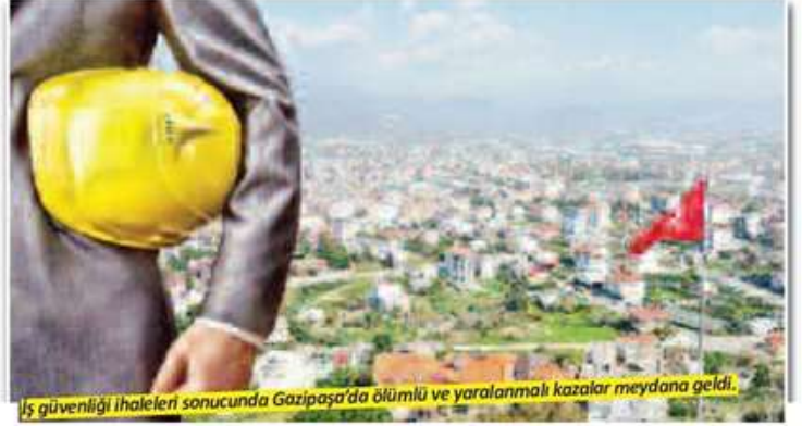
İş güvenliği ihaleleri sonucunda Gazipaşa'da ölümlü ve yaralanmalı kazalar meydana geldi.

Gazipaşa'da özellikle inşaat sektöründe çalışan işçilerin iş güvenliğine özen göstermemesi, yaşanan kazalardan ders çıkarılmadığını gözler önüne seriyor. Güvenlik öncelimi alınmadan yapılan çalışmalar ise ölümlü ve yaralanmalı kazalara davetiye çıkıyor. Birçok iş yeri, inşaat ve iş alanında işveren ve işçilerin iş güvenliğine dikkate almadığı gözlemleniyor. Ortaya çıkan görüntülere ve yaşanan ölümlü iş kazalarına isyan edenler, hem işverenlerin hem de işçilerin çalıştıkları esnada iş güvenliği önlemlerini almalarını, yetkililerin ise gerekli denetimleri yapmalarını, kurallara uymayanlara cezai