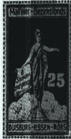
Almanya'da 8 saatlik iş günü için 1 Mayıs dayanışma pulları

larla, tüfeklerle rastgele ateş ediyorlardı. İşçiler savaş alanlarındaki askerler gibi öküldüler. Sonra işçilerin üzerine coplarla yürüdü. Vura vura dağıttılar onları. Fakat bu yeterli değildi. İşçi önderlerinden SPIES, bu olayı protesto etmek için işçileri Haymarket meydanında toplanmaya çağırdı.