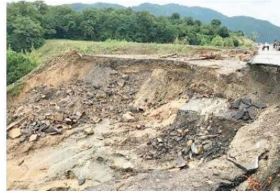
Bartın Ulus'taki heyelanda karayolları büyük zarar gördü.

Kastamonu: Kastamonu'nun Küre ilçesinde Salih