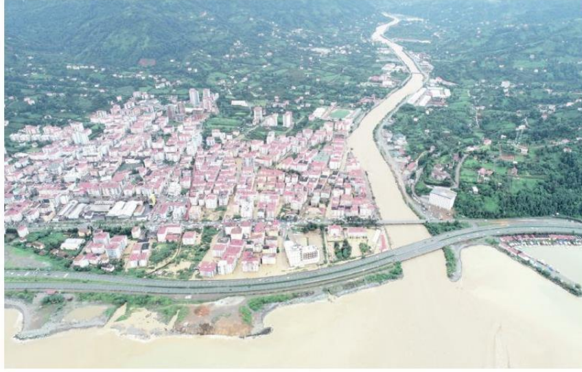
Artvin'de yaşanan sel felaketinin ardından, şehrin havadan görüntüsü böyleydi.