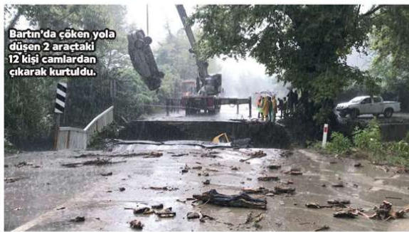
Bartın'da çöken yola düşen 2 araçtaki 12 kişi camlardan çıkarak kurtuldu.

de tek katlı bir evin yıkılıp sel sularına kapıldığı ve beraberinde yan binaların çatısına çıkan bazı yurttaşların ellerinde beyaz örtü sallayarak kurtarılmayı beklediği anlar görüntülendi. Sinop Belediye Başkanı Barış Ayhan, fabrikada işçileri mahsur kaldığını, bölgedeki hastanenin ise önlem amaçlı tahliye edildiğini duyurdu. Milli Savunma Bakanlığı, Sinop ve Kastamonu'da arama kurtarma helikopterlerinin Ayancık Devlet Hastanesi'ndeki hastaları