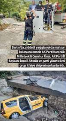
Bartında, şiddetli yağışta yolda mahsur kalan aralarında AK Parti Karabük Milletvekili Cumhur Ünal, AK Parti İl Başkanı İsmail Akıncı ve parti yöneticileri grup itfaiye ekiplerince kurtarıldı.

Sağlık Bakanlığınca 12 personel, 4 ambulans ile ilçe itfaiye ekiplerinin de olay bölgesinde görev yapıldığı ifade edilen açıklamada, "Karabük-Bartın yolu Bahçeçik mevkiisinde, yoğun yağış sonucu bir kopru meydana gelen noktada yaralanan 13 kişiden 8'inin tedavisi devam edilmektedir. Gelismeler takip edilmektedir." ifadesi kullanıldı.