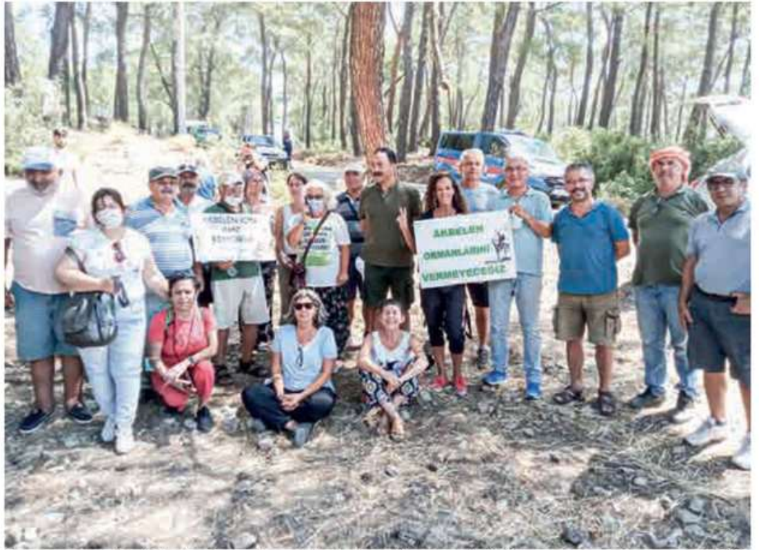
Yaşam savunucuları "Akbelen Ormanı'nı santrale kurban ettirmeyeceğiz" diyor.

Bunun yanında, devam eden orman yangınları sırasında bile, ağaç kesimine devam edildiği ifade edildi: "Sanki yangınlarla ormanlar yok olmamış ve halen yangınlar kontrol altına alınmamış gibi, Yeniköy Kemerköy Elektrik Üretim ve Ticaret A.Ş. ağaç kesimine başladı. Akbelen