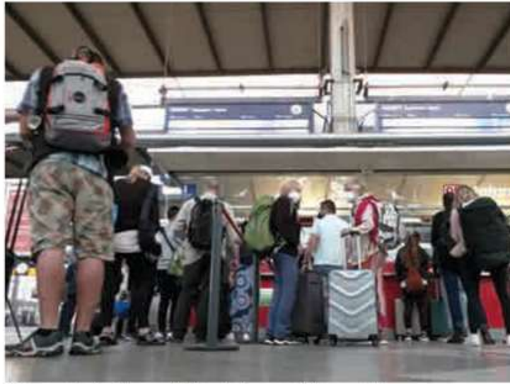
Grev sayesinde Almanya'da hayat durma noktasına geldi.

GDL ile Deutsche Bahn arasında süren toplu iş sözleşmesi görüşmelerinde şirket pandemi koşullarını gerekçe göstererek 40 ay boyunca maaşlara zam yapmayacağını belirtmiş ancak tepkiler üzerine son olarak gelecek yıl için yüzde 1,5 ve Mart 2023'te ise yüzde 1,7 zam teklifinde bulunmuştu. GDL ise teklif yetersiz bularak 28 ay geçerli olacak şekilde ücretlere