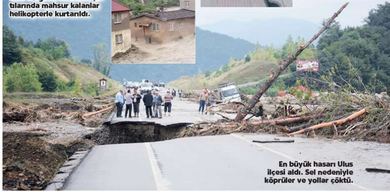
En büyük hasarı Ulus ilçesi aldı. Sel nedeniyle köprüler ve yollar çöktü.