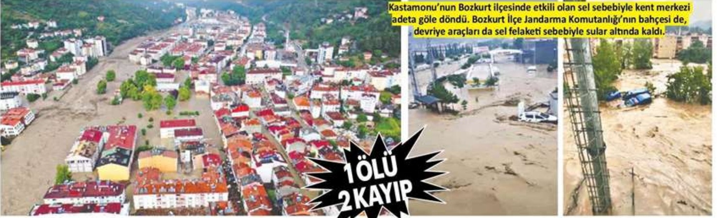
Kastamonu'nun Bozkurt ilçesinde etkili olan sel sebebiyle kent merkezi adeta göle döndü. Bozkurt İlçe Jandarma Komutanlığı'nın bahçesi de, devriye araçları da sel felaketi sebebiyle sular altında kaldı.