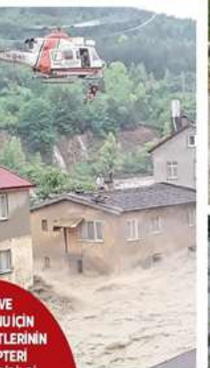
SİNOP VE KASTAMONU İÇİN HAVA KUVVETLERİNİN 2 HELİKOPTERİ GÖREVLENDİRİLDİ

Ulus Akoren Söküler köyünde kaybolan bir vatandaşın arama çalışmaları Bartın AFAD'dan 3 ekip, 6 personel ile devam ettiği belirtilen açıklamada, çalışmaları destek vermek için, Ankara AFAD'dan 21