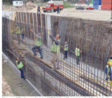
Hem emekçiler hem çalışanlar AKP iktidarı döneminde sürekli yoksullaştı.

Öte yandan bir an için enflasyonun doğru ölçüldüğünü kabul etsek bile, ücretleri enflasyona endekslemek çalışanların ve emeklilerin refahı için yeterli değil. Asıl önemli olan çalışanların ülke ekonomisindeki büyümeden, toplumsal zenginlik artışından pay alıp alamadıklarıdır. Ülkenin reel olarak enflasyonun çok üzerinde büyüdüğü durumlarda emekçiler bundan pay alamıyorsa bölüşüm ilişkileri