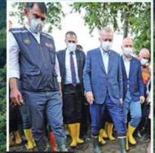
Cumhurbaşkanı, son durum hakkında bilgi aldı.