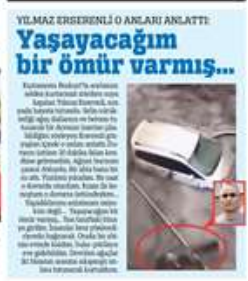
Yenişehir'de yaşanan sel felaketi nedeniyle bölgedeki vatandaşlar için sığınaklar bekleniyor. Selin etkisiyle bölgedeki vatandaşlar için sığınaklar bekleniyor.