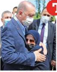
TGRT Haber canlı yayınında inek kurtarma

Yenişehir'de yaşanan sel felaketi nedeniyle bölgedeki hayvanlar için kurtarma çalışmaları devam ediyor. Selin etkisiyle bölgedeki hayvanlar için kurtarma çalışmaları devam ediyor. Selin etkisiyle bölgedeki hayvanlar için kurtarma çalışmaları devam ediyor.