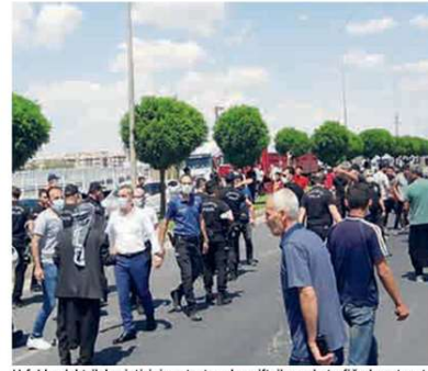
Urfa'da elektrik kesintisini protesto eden çiftçiler yolu trafiğe kapatmıştı.

TEİAŞ Yük Bilgi Sistemi, her gün emre amade olan santrallerin listesini de yayımlamaktadır. Kesintilerin olduğu gün, üretimleri mevsimsel ve doğa koşullarına bağlı olmayan doğalgaz ve kömür santrallerinin emre amade olan güçleri aşağıdaki gibidir: