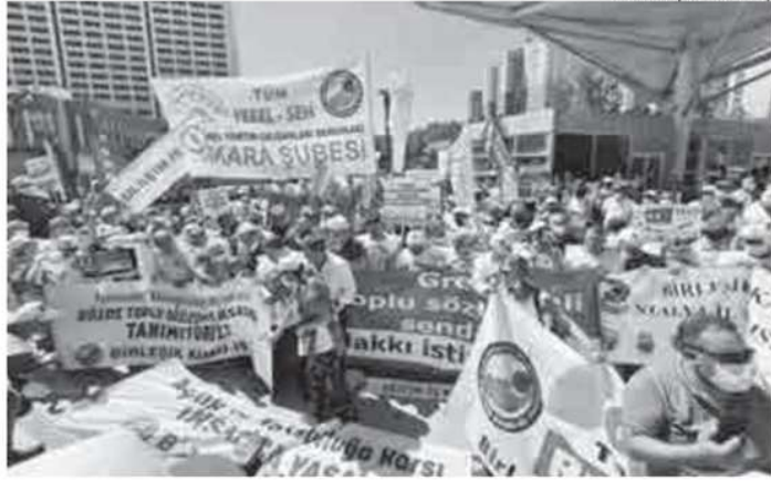
Açıklanan teklife emekçiler basın açıklamalarıyla tepki gösterdi.

İktidarın toplu sözleşme süreci için verdiği zam teklifinin kabul edilemez olduğuna dikkat çeken KESK Eş Genel Başkanı Mehmet Bozgeyik, kamu emekçileri ve emeklilerinin tepkilerinin yükseldiğini belirtti. Enflasyon hızlı bir ivmeyle artarken yapılan teklifin yoksulluğu gidermeyeceğini aktaran Bozgeyik yoksulluk sınırının 9 bin 500 lira olduğunu hatırlattı. Bozgeyik, "2019 ve 2021 yılları içerisinde emekçilerin kaybı 2 bin 500 liraya denk geliyor. Yaptığımız araştırmalarda gerçek enflasyonun yüzde 40'ları aştığını söyleyebiliriz. Bunun üzerinden yapılacak zammın emekçilerin kaybını karşılayacak şekilde yüzde 43,5 artış ve sosyal yardımlarla yoksulluk sınırının üze-