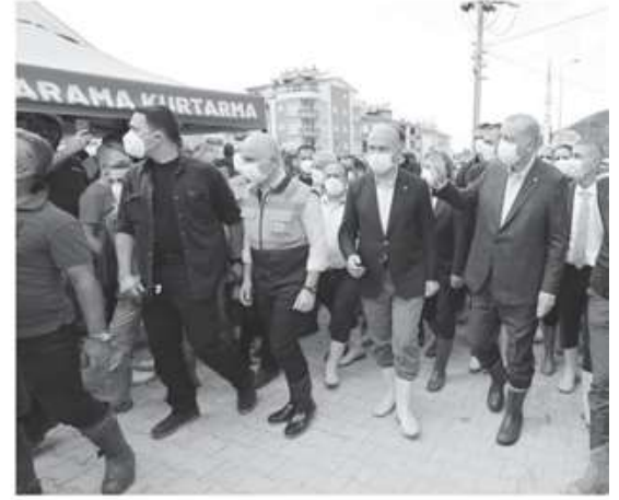
Cumhurbaşkanı Erdoğan, sel ve su baskınlarının meydana geldiği Kastamonu'nun Bozkurt ilçesinde incelemelerde bulundu.

■ YANGINLARIN ALTINDAN KALKAMADILAR: İşte Antalya, Manavgat, Burdur her yeri gördünüz. ABD'si Rusya'sı yangınların altından kalkamadılar hala. Biz 20 günü bulmadan buralarda bu afetlerden büyük oranda kurtulduk. Ormanlarımız yandı, bitmedik ki, şimdi 19 senede biz bu ülkede 5,5 milyar fidan değil ha ağaç diktik, ağaç. Nasıl diktiysek yine diyeceğiz. -AA