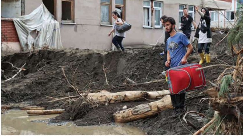
Sel felaketinin ardından binlerce yurttaş evsiz kalırken 250'den fazla yurttaşın ise kayıp olduğu ifade ediliyor.

Sel felaketinde en az 51 yurttaşın hayatını kaybettiği açıklanırken birçok yurttaş ise hâlâ kayıp. Bozkurt'taki yurttaşlar, bir buçuk gün çatıda kurtarılmayı beklediklerini ancak helikopterin gelmediğini anlattı