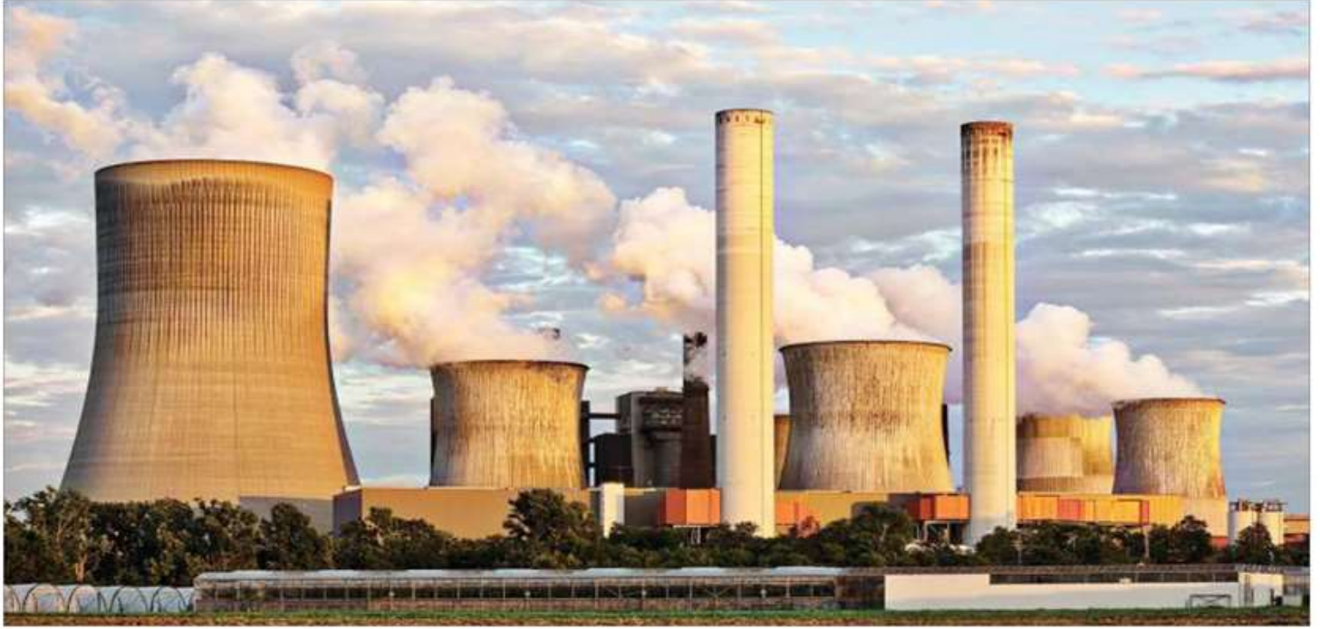
Türkiye'de kullanılan elektriğin üçte biri kömürlü termik santrallerden karşılanıyor.