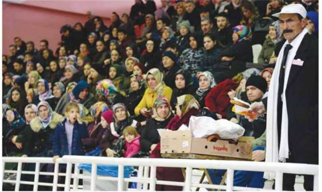
Yozgat'ta bin kişilik geçici işe on binlerce kişi başvurmuştu.

İkincisi, 2008'den itibaren işverenin SGK prim katkısının yüzde 5'inin İSF kaynaklarından ödenmeye başlanmasıdır. Üçüncüsü, 2014'ten itibaren İSF'den fonlanan "Aktif İşgücü Programları" (AİP) ile daha sonra buna eklenen "İşbaşı Eğitim Programları" üzerinden işverene ucuz işgücü sağlanmasıdır. (bu sayede TÜİK'in resmi işsizlik sayıları da aşağıya çekilmektedir). Hızla büyüyen bu "programlara" ayrılan kaynaklar, 2015 ve 2016'da yıllık bazda İÖ ödemelerinin üzerine çıkmıştır. Böylece, işveren üç koldan desteklenmiştir. Buna, işverenin İSF kesintilerini belirli süreler faizsiz bir kaynak olarak kullanma olanağını, hatta