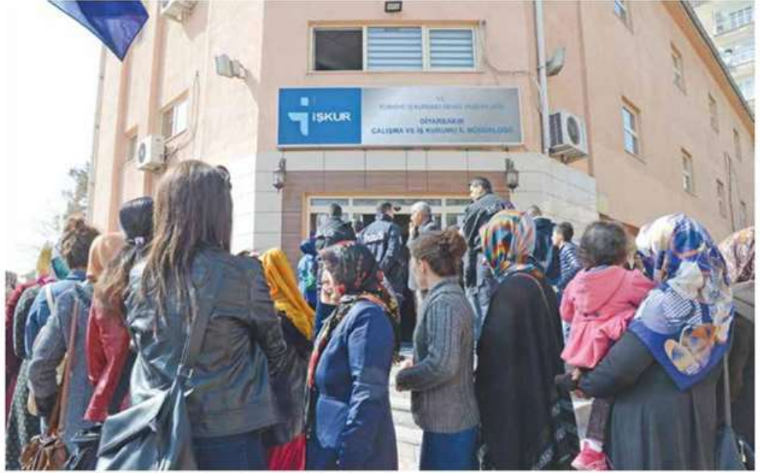
Diyarbakır'daki İş Kur İl Müdürlüğü önünde uzun kuyruklar oluşmuştu.

Eğer İşsizlik Sigortası Fonu'nun, yüzü işçiye dönük olup bir de bir iş güvencesi yasasıyla birlikte yürürlüğe girmiş olabilseydi, bu sigortanın kayıtdışılığı önleyici bir işlev de üstlenmesi pekala mümkündür.