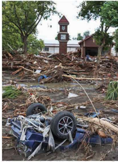
Felaket sonrası ortaya çıkan enkaz böyle görüntülendi.

tarihimizin en sıcak günlerini artık her sene yeni rekorlarla görmeye devam edeceğiz. Dolayısıyla yaşanan kayıpların birinci dereceden sorumluları; bilimin ve teknolojinin rehberliğinde doğa olaylarının afete dönüşmesi engellenilebilecekken; gündelik çıkarlar ve rant uğruna sağlıksız, risklere karşı dirençsiz yaşam alanları inşa eden yönetim anlayışdır."