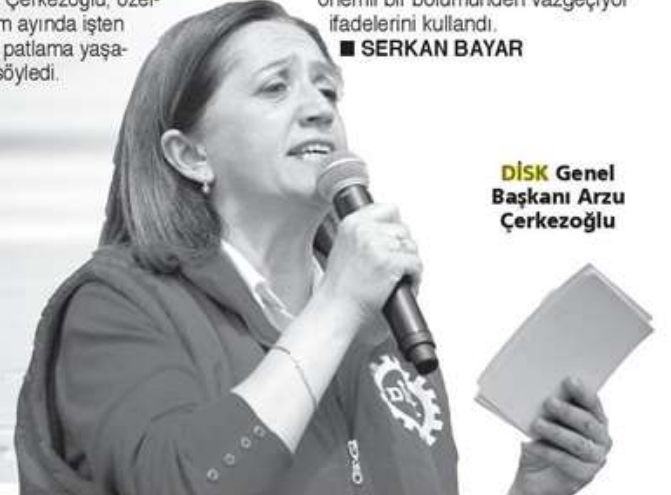
DİSK Genel Başkanı Arzu Çerkezoğlu