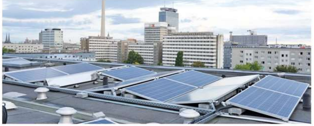
Dünyanın en çok güneş alan ülkelerinden biri olan ülkemizde devletin devreye aldığı 750 bin ile 1.5 milyon TL arasında değişen GES yatırım hibe ve destekleri her geçen gün artan enerji maliyetlerini en aza indirmenin ve kâra geçmenin bir numaralı çözümünü oluşturuyor

Fabrika, tarla ya da konut. Fatura maliyetlerinin yüzde 50'si elektrik tüketiminden geliyor. Bu faturalar da günden güne katlanarak büyüyor. Öte yandan güneş ile elektrik üretmek ise şirketleri ve bireysel kullanıcıları daha ilk