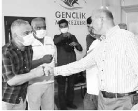
gayretli çalışmalar sonrasında bazen duygulu anlar yaşayarak acılarını askerlere