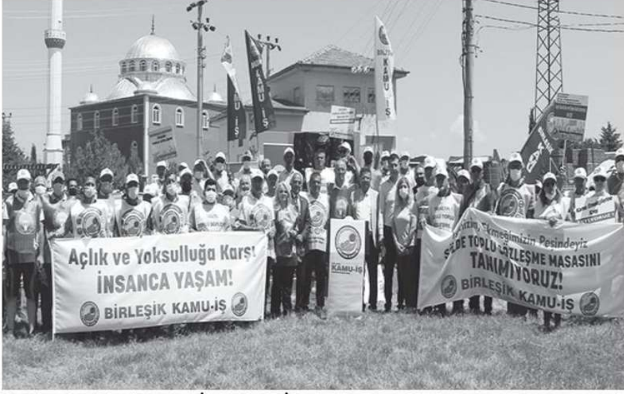
Burdur'da Birleşik Kamu-İş üyeleri TİS taleplerini açıkladı.