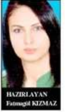
HAZIRLAYAN Fatmagül KIZMAZ