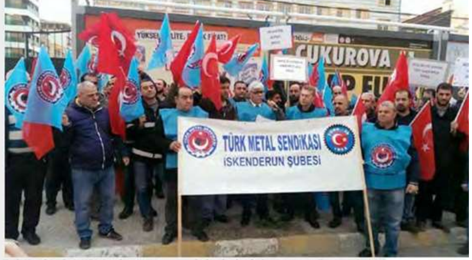
Türk Metal üyeleri, MESS'in olumsuz tutumunu, kitlesel eylemlerle protesto ettiler.

4- 22 Ocak Tarihli Türk Metal Yönetim Kurulu açıklaması, http://www.turkmetal.org.tr/haberler/guncel-haberler/204349