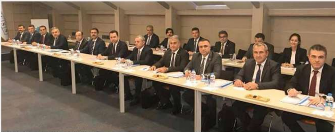
MESS Görüşmelerinde Türk Metal Heyeti.

Sözleşme görüşmelerinin ilk oturumları, bu dönemde anlaşmazlık konusu yapılmayan maddeler üzerinde mutabakat sağlanarak tamamlandı. Müzakerelerin başlangıcından itibaren her oturumun sonunda sendika tarafından sosyal medya ve telefon mesajları ile bildirimler yapılırken, şube