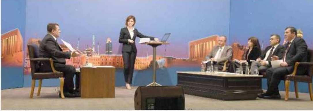
Türk Metal Sendikası Genel Başkanı Pevrul Kavlak, görüşme sürecinde, gazetecilerle sık sık bir araya geldi.

yöneticilerinin ve işyeri sendika temsilcilerinin de hiç vakit kaybetmeden işyerlerine giderek işçileri bizzat bilgilendirmeleri sağlandı. Sözleşme görüşmeleri hakkında zamanında ve doğru bilgilendirme için sendikamızın tüm imkanları ve kadroları seferber edildi.