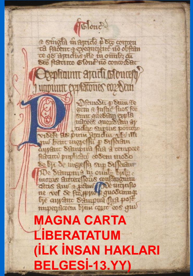
MAGNA CARTA LIBERATATUM (İLK İNSAN HAKLARI BELGESİ-13.YY)

Böyle giden bir işleyişe "dur" diyebilmek için 1215 yılında İngiltere Kralına kabul ettirilen bildirge, Magna Charta (Magna Karta) İnsan